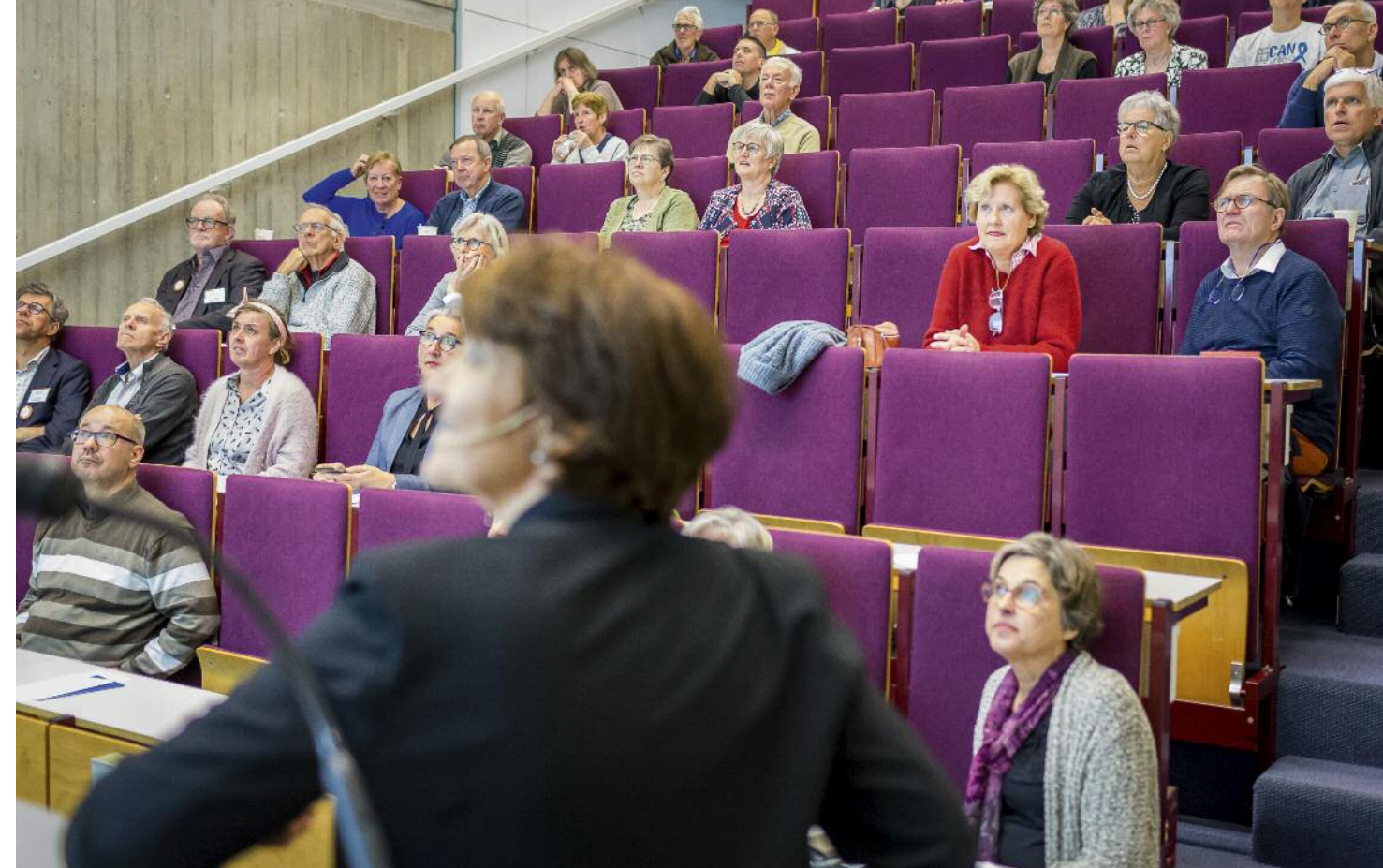
Symposium Stomadag Leiden