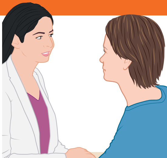
gesprek met stomaverpleegkundige